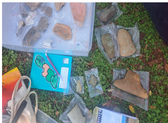
2- Detalhe de artefatos expostos para aula dinâmica ao ar livre.