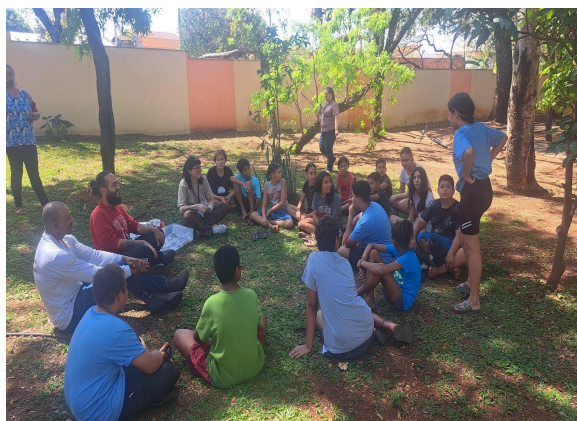
1- Atividade realizada na semana do meio ambiente sobre povos ancestrais e o contexto sócio-ambiental.