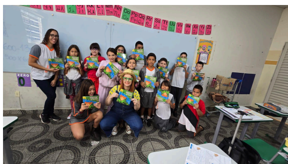
5- Grupo do Projeto Xerifes Ambientais realizado ao longo do ano em parceria com a UHE Igarapava.