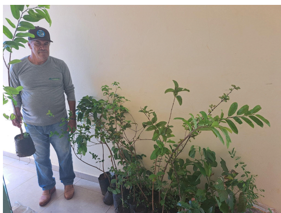
3- Doação de mudas na Secretaria de Meio Ambiente. Semana do Meio Ambiente.