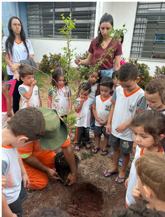
13- Atividade de Plantio realizada no Ensino Primário