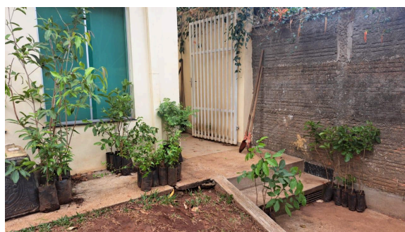
6- Doação de mudas na Secretaria do Meio Ambiente.