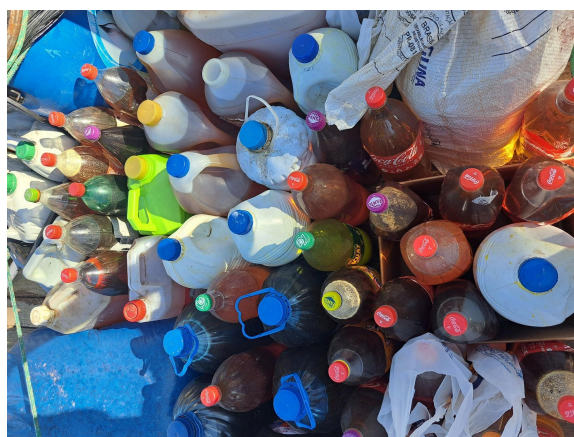
4- Projeto de conscientização que estimula a preservação da água. Troca de óleo sujo por óleo limpo.