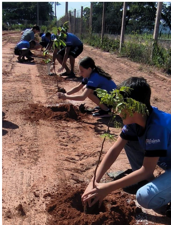
14- Atividade de Plantio realizada com os jovens do