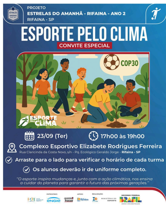
12- Cartaz de divulgação das atividades realizadas em parceria com o Instituto Chui, relacionada às mudanças climáticas.